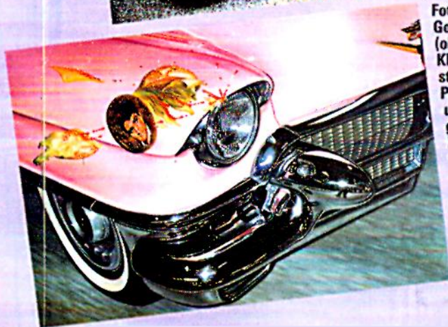
Foto oder Gemälde? (oben) Kluckert besticht durch Perfektion – und Extravaganz. Das Elvis-Portrait auf dem Cadillac ist sicher einzig – und gar nicht artig.